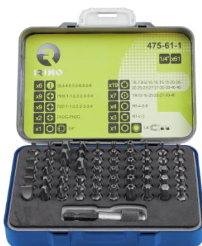
● 475-61-1 JGO PUNTAS 1/8" 61 Pzs