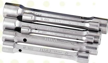
● 056131 JGO DE 8 LLAVES DE TUBO DOS BOCAS 6-7 - 20-22mm