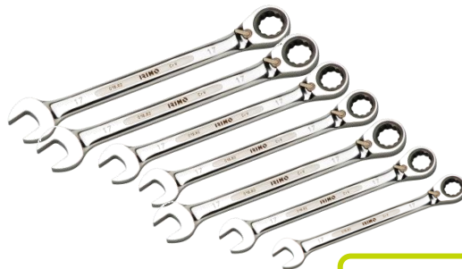
● 018701 JGO DE 7 LLAVES COMBINADAS CON CARRACA 8, 10, 11, 12, 13, 17, 19mm