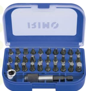
● 475-32-1 JGO DE PUNTAS DE 1/8" 31 Pzs