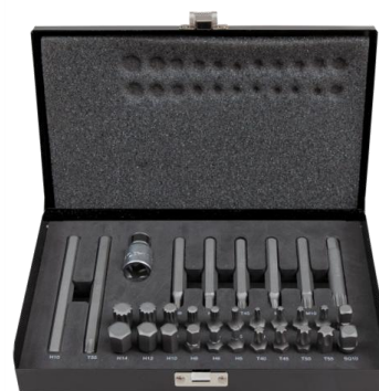
● 471151 JGO DE VASOS CON PUNTA 31 Pzs 10mm