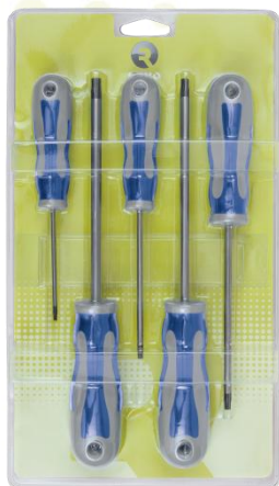
● 459-5-B JGO DE 5 DESTORNILLADORES PLANO-PHILLIPS Recta 3x75/4x100 Plana 6.5x150 PH1, PH2