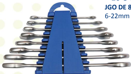
● 10-8-H JGO DE 8 LLAVES FIJAS 6-22mm